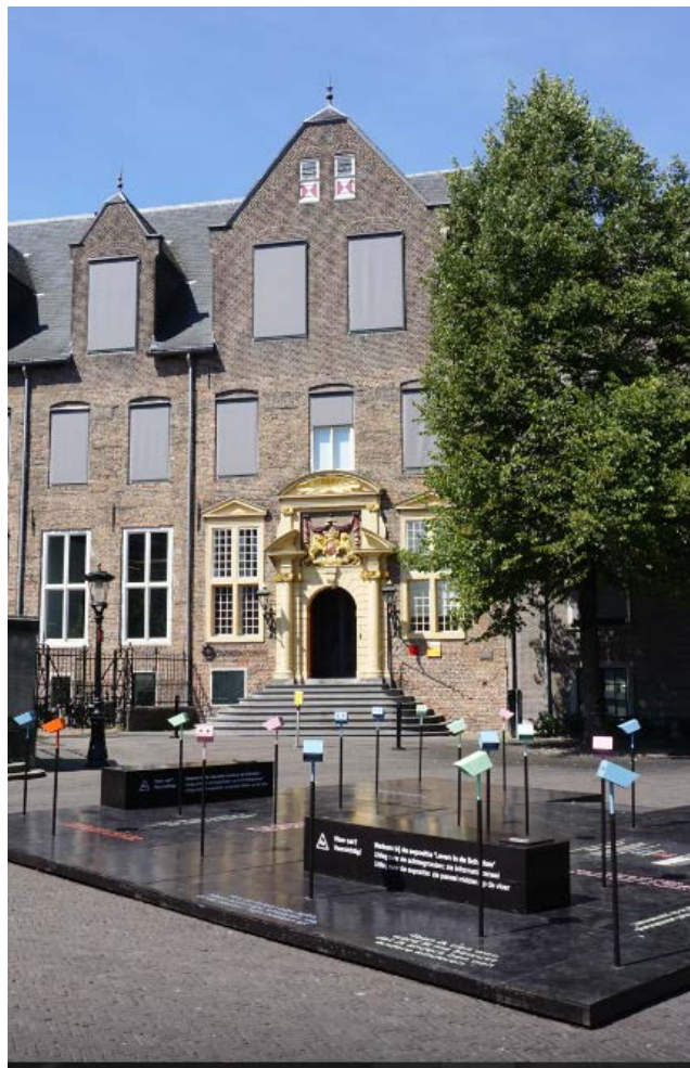
Utrecht University (2014) Fakulta REBO