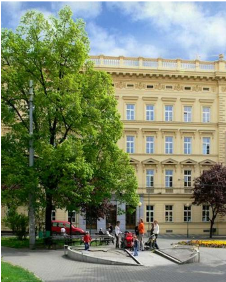
Masarykova Univerzita (2012) Rektorát (Odbor VaV)