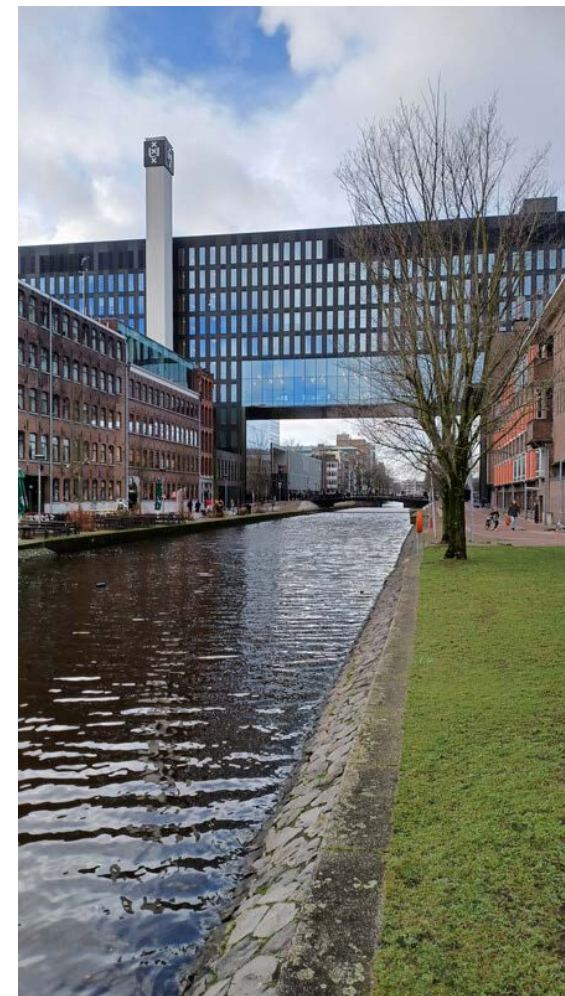
University of Amsterdam (2019) IXA, Fakulta FMG